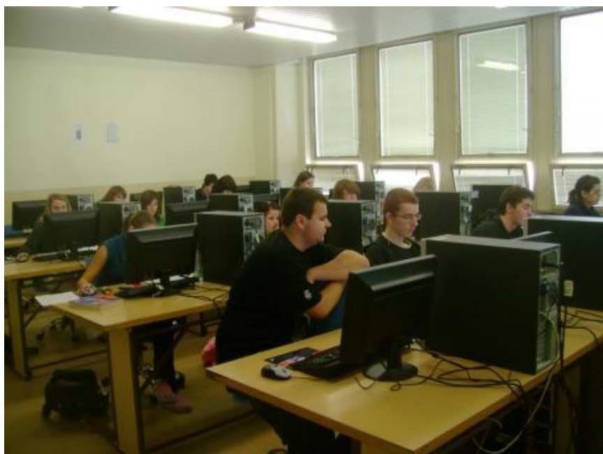
Odborná učebňa č. 102 na vyučovanie predmetov - aplikovaná informatika, administratíva a korešpondencia