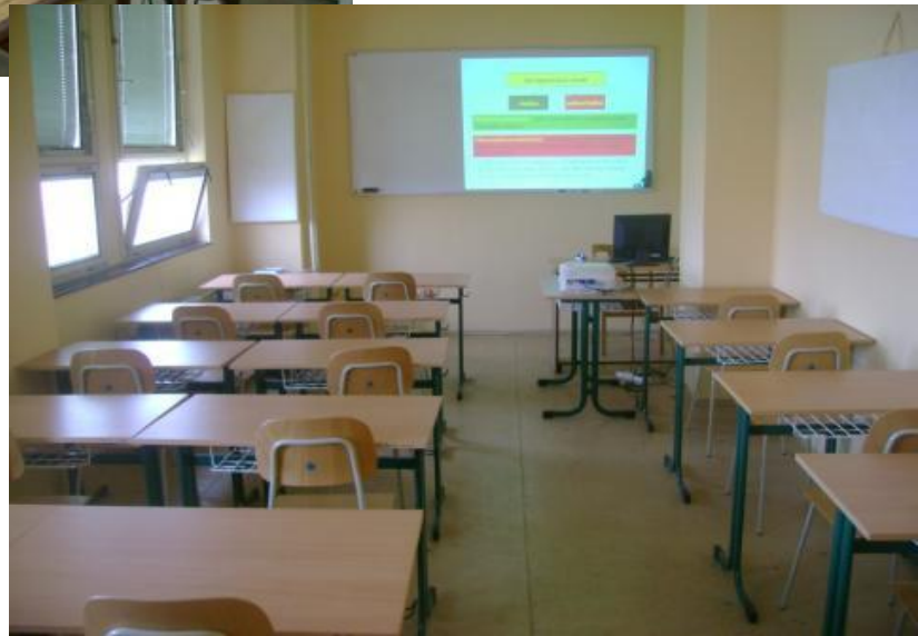
Odborná učebňa na vyučovanie odborných predmetov praktickej prípravy