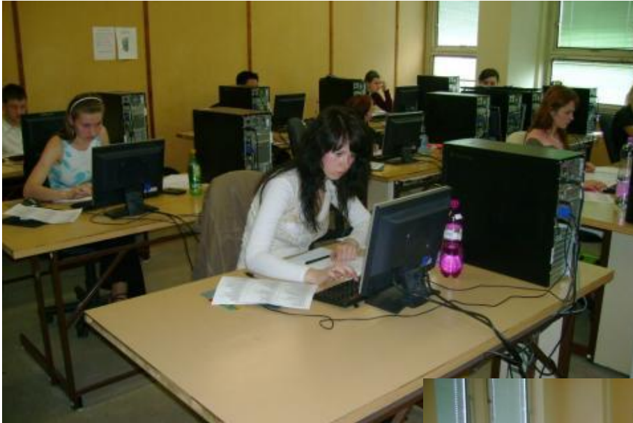
Odborná učebňa č. 115 na vyučovanie predmetov - ekonomické cvičenia, ekonomické aplikácie