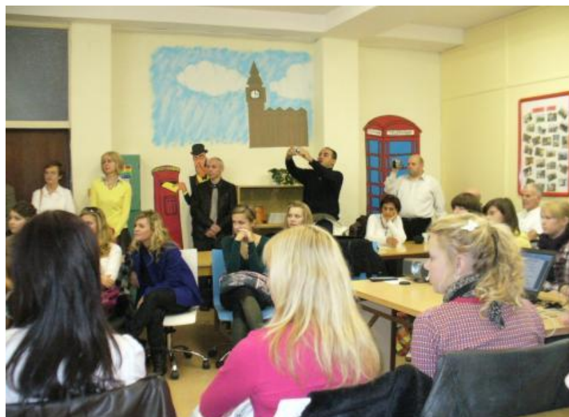
Odborná učebňa č. 103 na vyučovanie cudzích jazykov