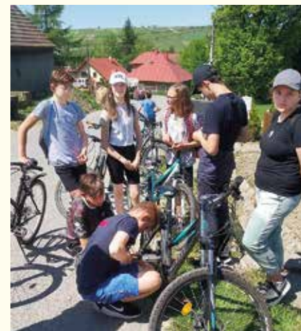
...pokazený bicykel treba opraviť...