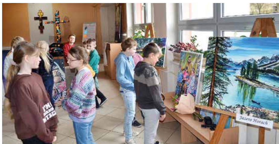
Blažejova výstava na hlavnej chodbe

• Som hrdý na všetky svoje obrazy, ale ak by som si mal vybrať, bol by to asi Archanjel Michal a Panna Mária Guadalupská. Obraz sa nachádza