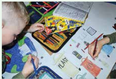
Projektové vyučovanie zamerané na životné prostredie