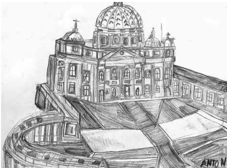
Anton Grižák, 4. B