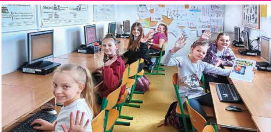
Pozdravujú vás žurnalistky

Časopis žiakov Cirkevnej základnej školy sv. apoštola Pavla v Sihelnom č. 2/2023