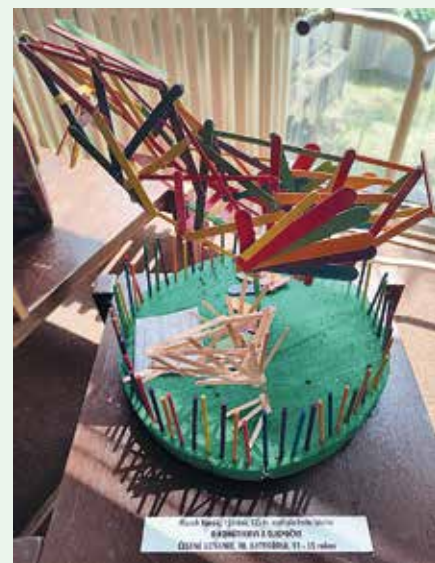
Marekova víťazná práca