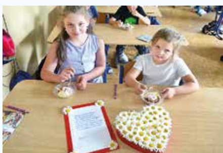
Beseda s Jožkom o živote Panny Márie

rozhlase a aktivitou na hlavnej chodbe. Deti mali za svoje dobré skutky a modlitby lepiť k jej obrázku kvietky. Na každý deň bol zvolený iný kvietok, ktorý symbolizoval nejakú čnosť.