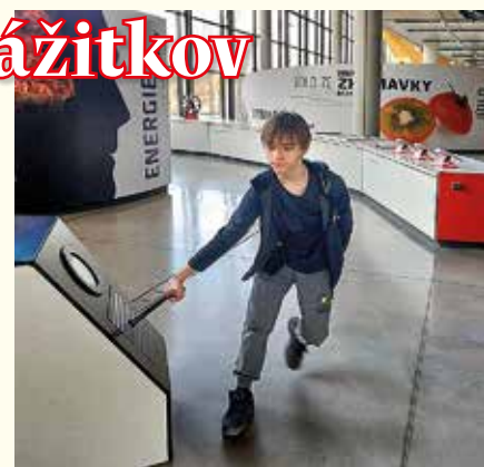
V technickom múzeu v Ostrave

» Skvelý deň prežili aj žiaci z I. stupňa. Vybrali sa do Oravskej dediny v Zuberci na podujatie Zahrajme sa ako kedysi. Vyskúšali si tu tradičné remeslá našich predkov ako sú drotárstvo, tkáčstvo, garbiarstvo, výrobu sviečok...Svoje výrobky si potom hrdo odnášali domov. Zaujímavosťou pre nich bolo aj vyučovanie v historickej škole, kde sa písalo gríflom na tabuľky alebo pierkom namočeným v kalamári. Malovali na sklo a dozvedeli