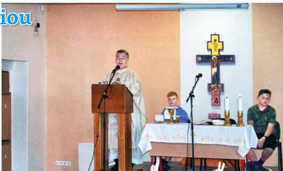
Svätá omša na odpust Matky ustavičnej pomoci

Tento mesiac sme Pannu Máriu oslávili aj rannými modlitbami v školskom