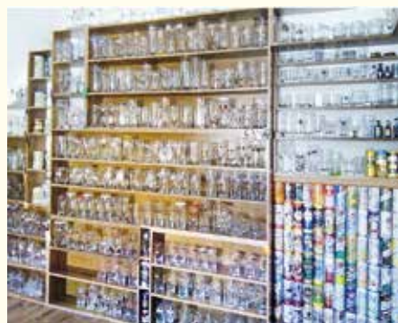
Pohárom je venovaná celá podkrovná izba

sa niektorý nerozbil. Zúčastňuje sa rôznych pivových búr, kde si kupuje a vymieňa poháre s inými vášnivými zberateľmi. V jeho zbierke môžete nájsť aj rôzne netradičné poháre. To sú napríklad poháre zo zaniknutých pivovarov, napríklad Oravar. V zbierke má aj 50-ročné poháre. Niektoré majú zberateľskú hodnotu viac ako 80 eur. Mnohé pochádzajú rôznych častí sveta, napríklad Austrálie, Ameriky. Zbieraniu pohárov sa venuje 25 rokov. S pivom začal ako študent pri rozvoze piva. Odlepoval etikety z fliaš, ktoré si odkladal. A keď sa vyskytli poháre s logom pivovaru, začal ich zbierať. Poháre sú podľa pivovarov zoradené v poličkách. Na Slovensku je asi okolo sto malých pivovarov. Skoro