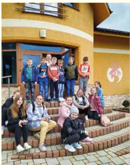
5.B u saleziánov