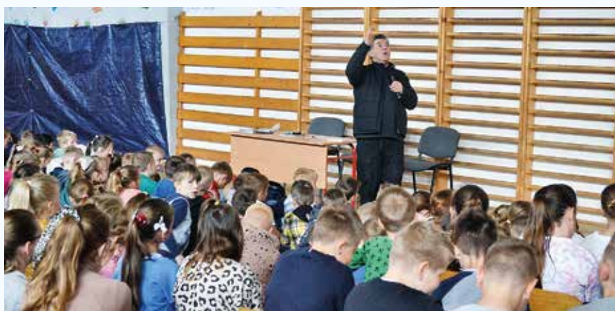
Beseda s Jožkom o živote Panny Márie