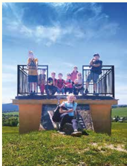
...piatáci na prechádzke pri Titusovi...