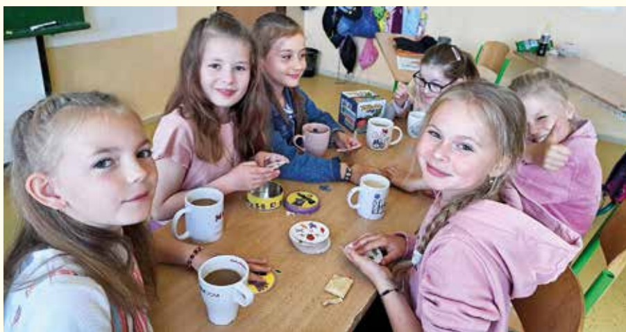
3.A oslavujú 13. júna sv. Antona