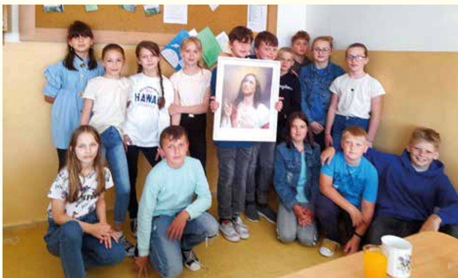
Božské srdce Ježišovo oroduje za 5.A