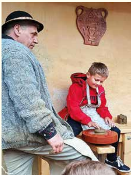
V Zuberci vyskúšali rôzne remeslá