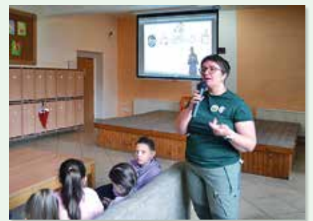
Beseda o ochrane prírody

Dňa 22. apríla je Deň Zeme. Pri tejto príležitosti sa žiaci počas celého dňa