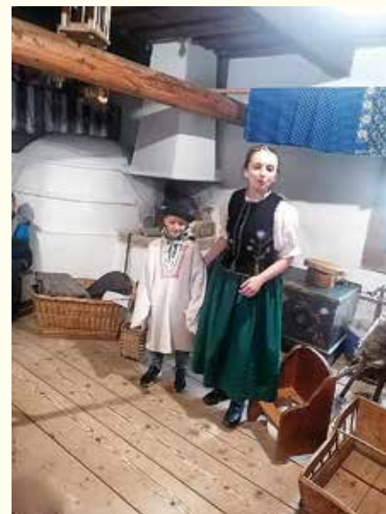
V Oravskej galérii v Dolnom Kubíne