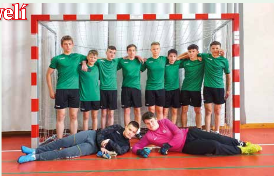
Chlapcom blahoželáme k skvelému výkonu