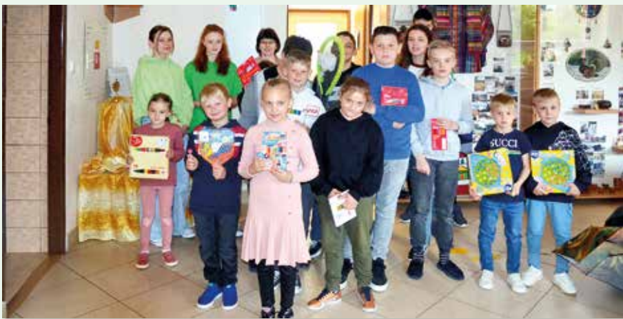
Najusilovnejší zberači železa