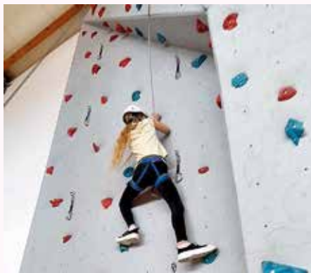
Lezenie naše deti veľmi obľubujú

učiteľ vedie aj Futbalový záujmový útvar. Ten vo veľkom obľubujú chlapci a tešia sa z výborných výsledkov v súťažiach. Ďalším športovým krúžkom je aj Gymnastický. Vedie ho pani učiteľka Kakačková. Hlavne dievčatá tu ukazujú svoju ohybnosť a šikovnosť a z nacvičených cvikov vytvárajú gymnastické zostavy. Pohybu majú deti dosť aj vo folklórnom krúžku Sihelček. Okrem spevu goralských piesní totiž deti nacvičujú ľudové tance. Svoje choreografie potom prezentujú