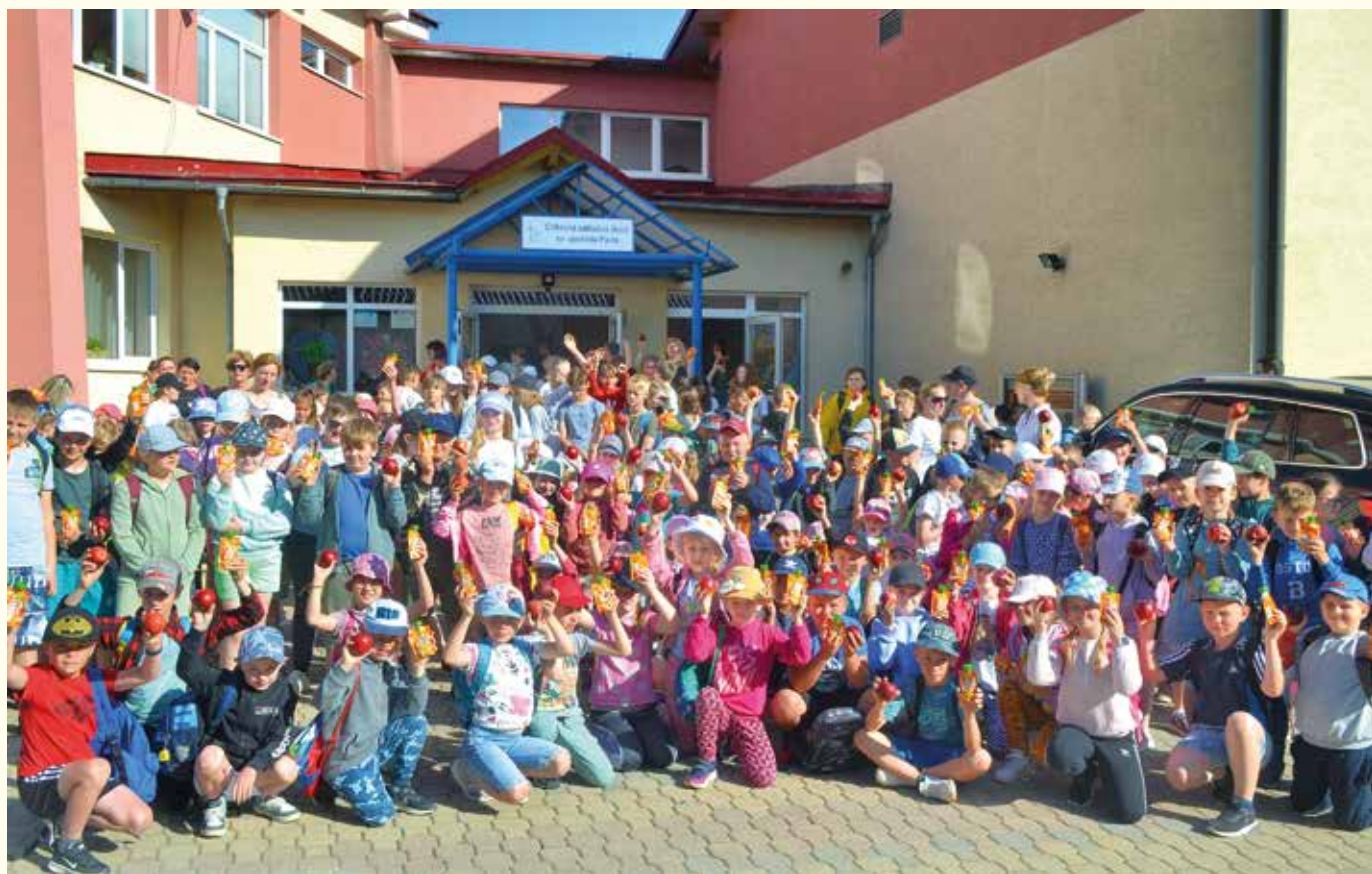
Veselý MDD s vitamínmi