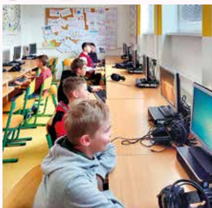
Chlapci na počítačovom krúžku