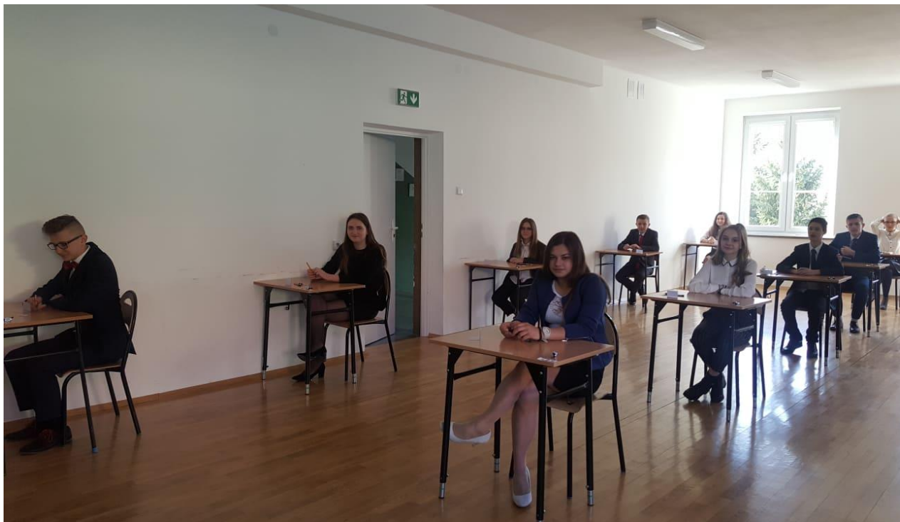
Uczniowie klasy VIII