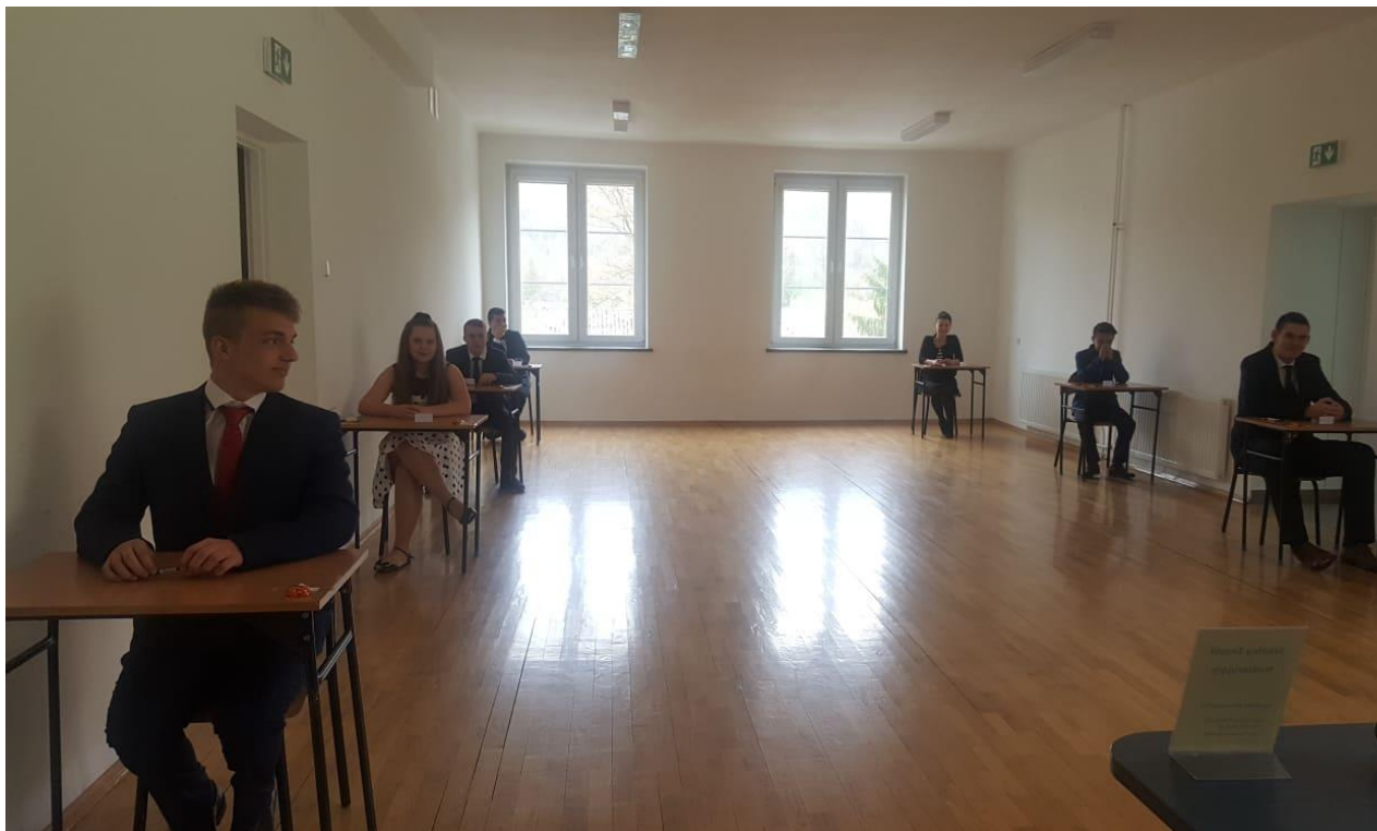
Uczniowie klasy III gimnazjum