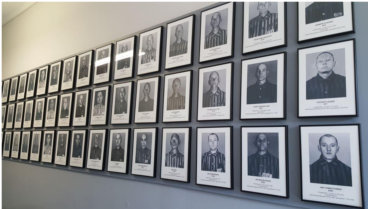
Pamiętajmy o wszystkich, którzy zginęli za niewinność!