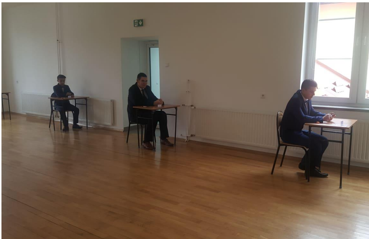
W skupieniu zmierzali się z zadaniami egzaminacyjnymi