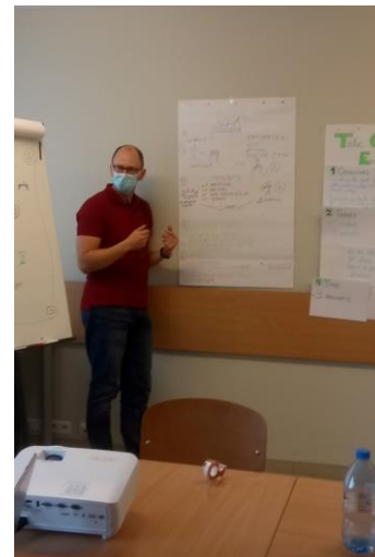
Práca celej skupiny a záverečná prezentácia komplexnej úlohy