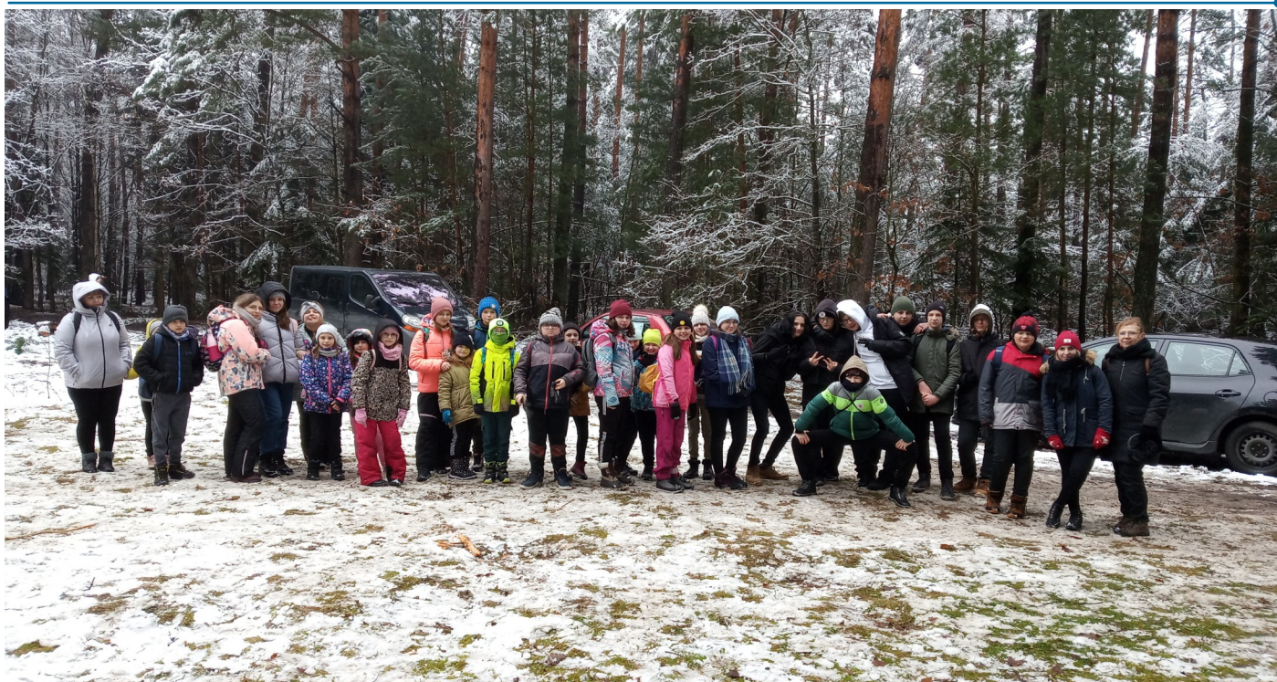
Zjazd Turystyczny Szlakiem Powstańców Styczniowych