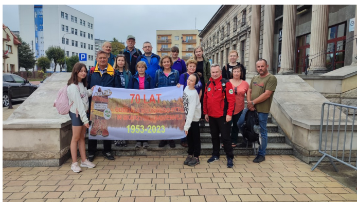
70 - lecie PTTK